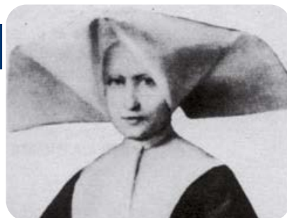
Santa Caterina Labouré (1806-1876).

Prima colazione. Incontro con la guida per il proseguimento della visita di Parigi. Pranzo in ristorante. Trasferimento all'aeroporto per il rientro in Italia.