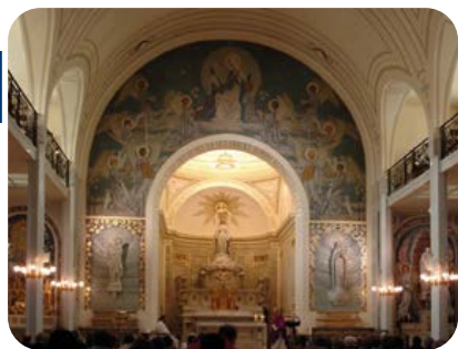
Cappella delle apparizioni, Rue du Bac, Parigi.

Prima colazione. Incontro con la guida. Giornata dedicata alla devozione di Nostra Signora della Medaglia Miracolosa, nella Cappella dove nel 1830 Maria è apparsa alla novizia Caterina Labouré e del quartiere Montmatre. Santa messa e preghiera personale. Rientro in hotel. Cena in ristorante. Pernottamento.