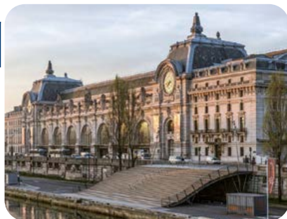
Museo D'Orsay, Parigi.

Arrivo il mattino all'aeroporto Charles de Gaulle. Incontro con la nostra guida italiana e salita sul pullman. Visita guidata di Parigi per l'intera giornata. Al mattino: visita panoramica dei punti più importanti della città. Al pomeriggio: visita al Museo D'Orsay - Al termine sistemazione in hotel. Cena in un «ristorantino» vicino all'hotel. Pernottamento.